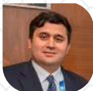
ИНОМЖОН АБДУРАХМОНОВ Начальник департамента Внешней торговли Министерства инвестиций, промышленности и торговли РУз