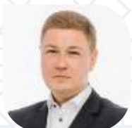
АРТЕМ СОКОЛОВ Президент Ассоциации компаний интернет-торговли (АКИТ)