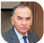
ХУРРАМ ТЕШАБАЕВ Заместитель министра инвестиций, промышленности и торговли Республики Узбекистан