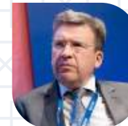
ВЛАДЛЕН МАКСИМОВ Вице-президент «ОПОРЫ РОССИИ», президент Ассоциации малоформатной торговли