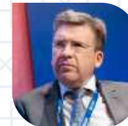
ВЛАДЛЕН МАКСИМОВ Вице-президент «ОПОРЫ РОССИИ», президент Ассоциации малоформатной торговли