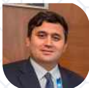
ИНОМЖОН АБДУРАХМОНОВ Начальник департамента Внешней торговли Министерства инвестиций, промышленности и торговли РУз