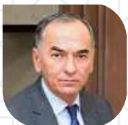
ХУРРАМ ТЕШАБАЕВ Заместитель министра инвестиций, промышленности и торговли Республики Узбекистан