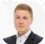
АРТЕМ СОКОЛОВ Президент Ассоциации компаний интернет-торговли (АКИТ)